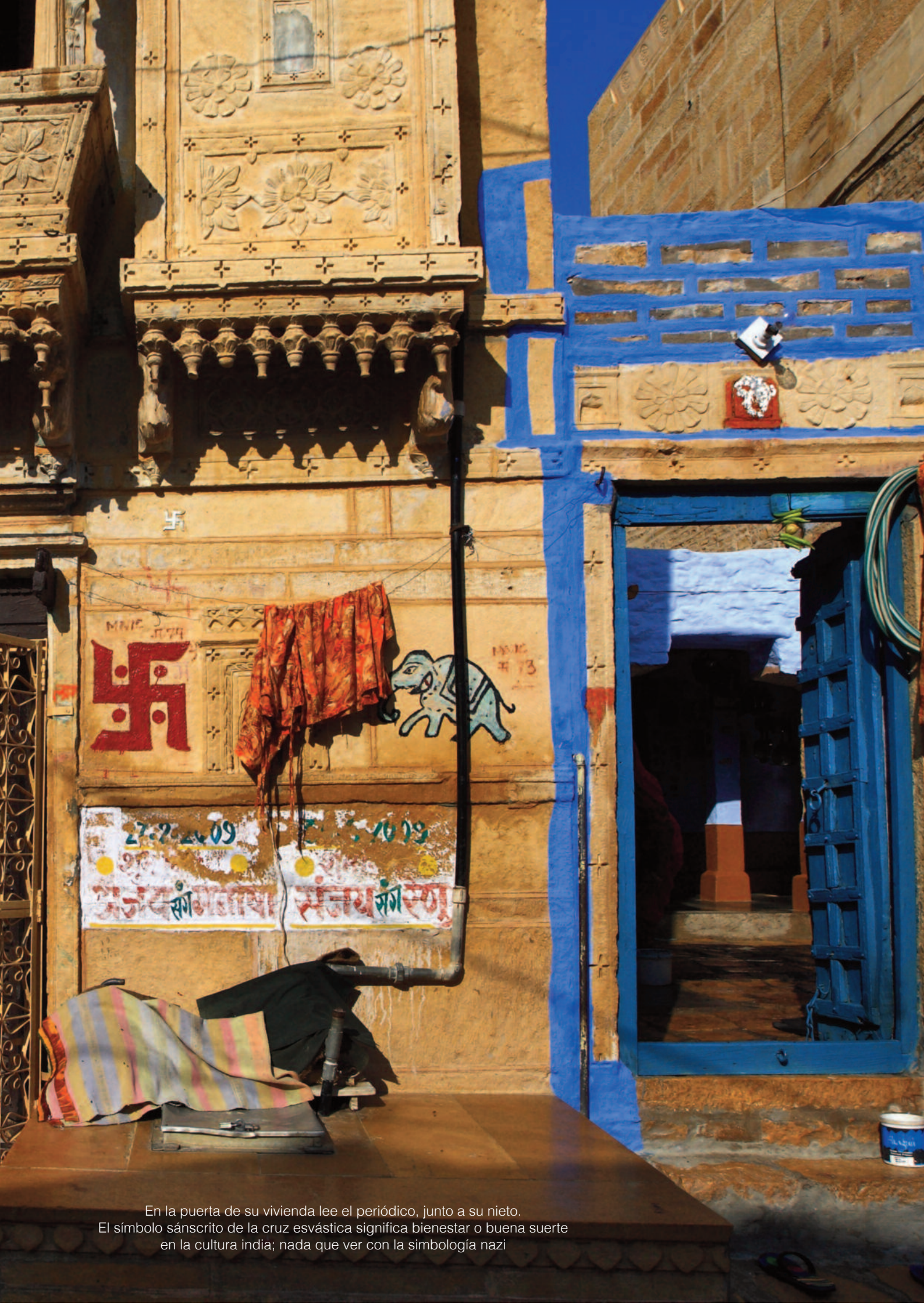
En la puerta de su vivienda lee el periódico, junto a su nieto. El símbolo sánscrito de la cruz esvástica significa bienestar o buena suerte en la cultura india; nada que ver con la simbología nazi