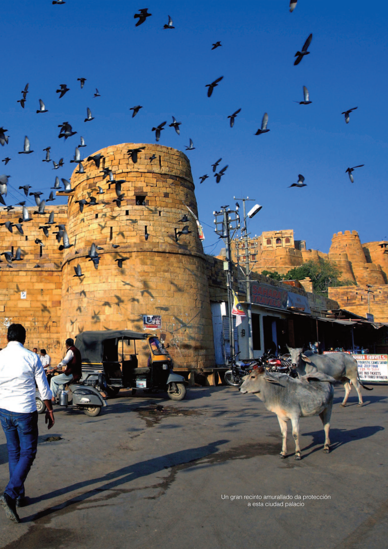
Un gran recinto amurallado da protección a esta ciudad palacio