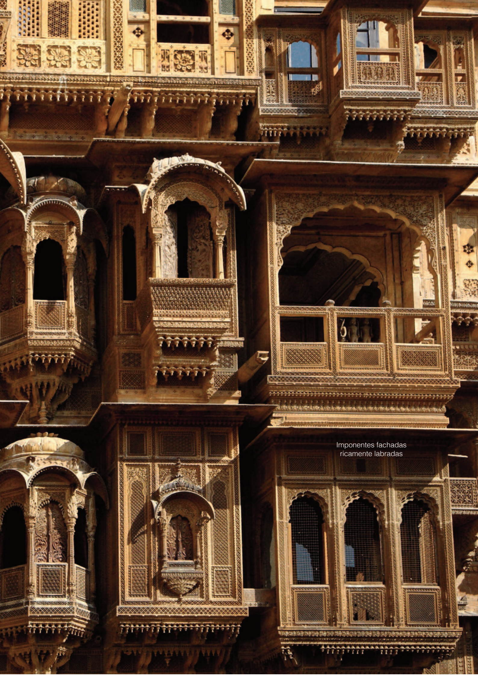
Imponentes fachadas ricamente labradas