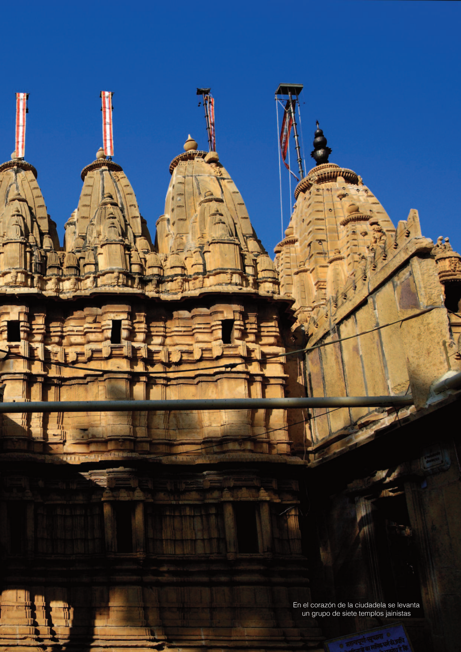
En el corazón de la ciudadela se levanta un grupo de siete templos jainistas

● सत्यपूर्ण-पूजना ● ● जैनधर्म का सत्य धर्म की प्रविष्टि ● ● जो यशोवर्धन है कि