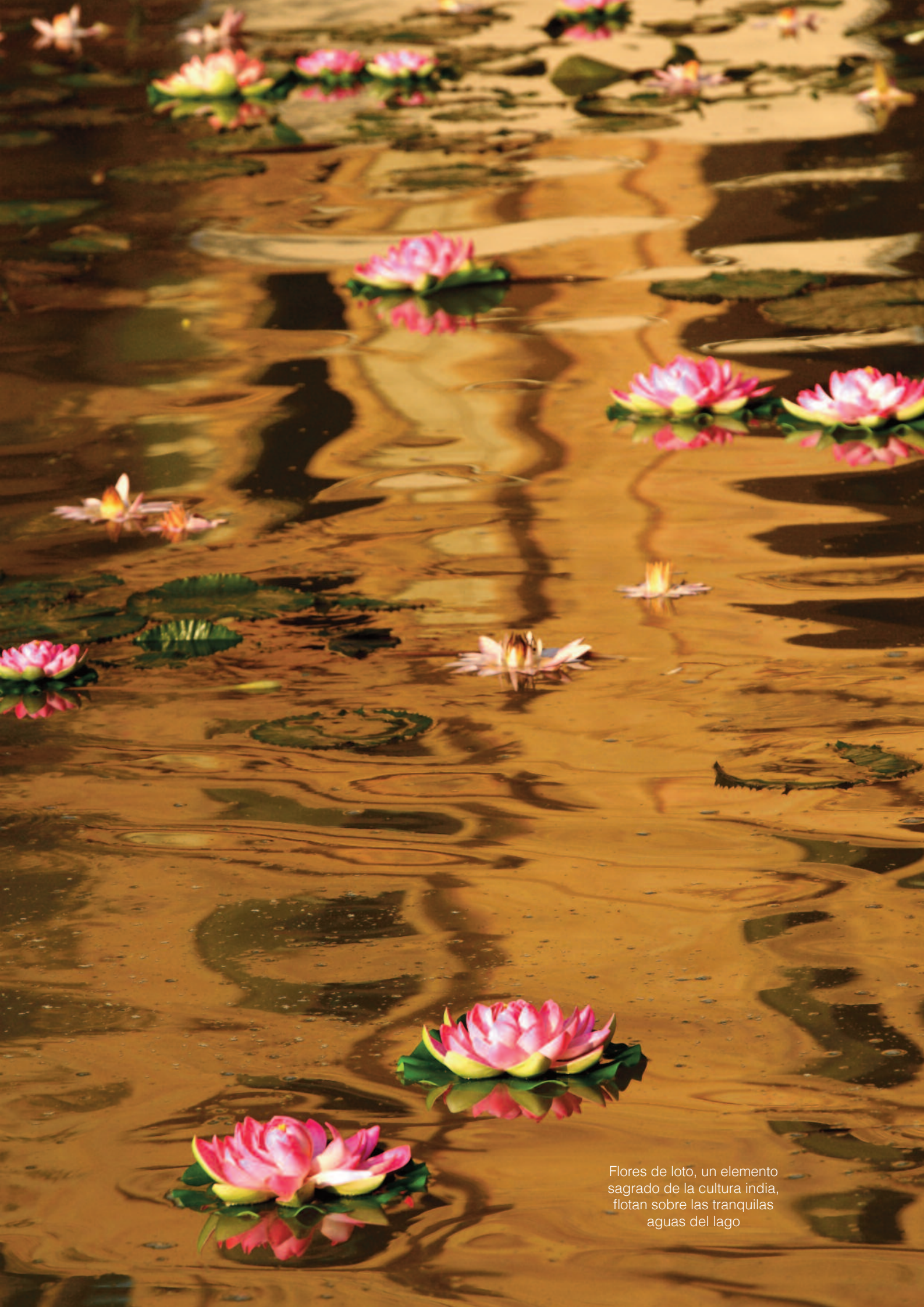
Flores de loto, un elemento sagrado de la cultura india, flotan sobre las tranquilas aguas del lago