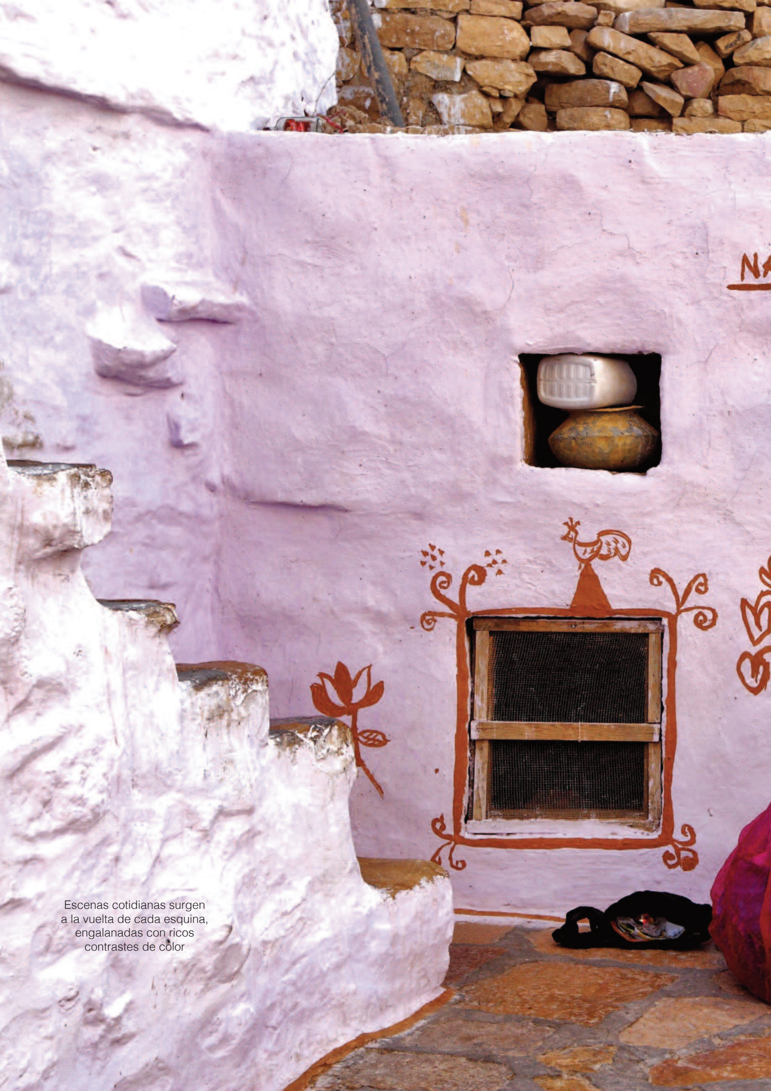
Escenas cotidianas surgen a la vuelta de cada esquina, engalanadas con ricos contrastes de color