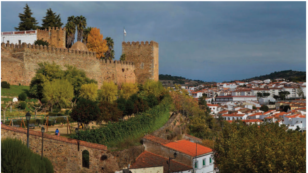
Parte de la muralla y el parque de Santa Lucía. Al fondo la Torre Sangrienta.

Al interior del nuevo recinto amurallado, de unos 150.000 m 2 se accedía por seis puertas: Burgos, Alconchel, Sevilla,