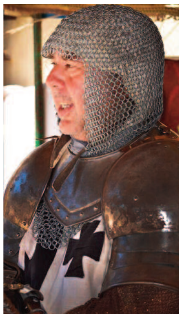
Un caballero templario durante el Festival.

El segundo fin de semana de Mayo se congregan en el Recinto Ferial las principales firmas de la industria jamonera de España. Degustaciones, platos de compra-venta, encuentros familiares y de amigos, charlas y