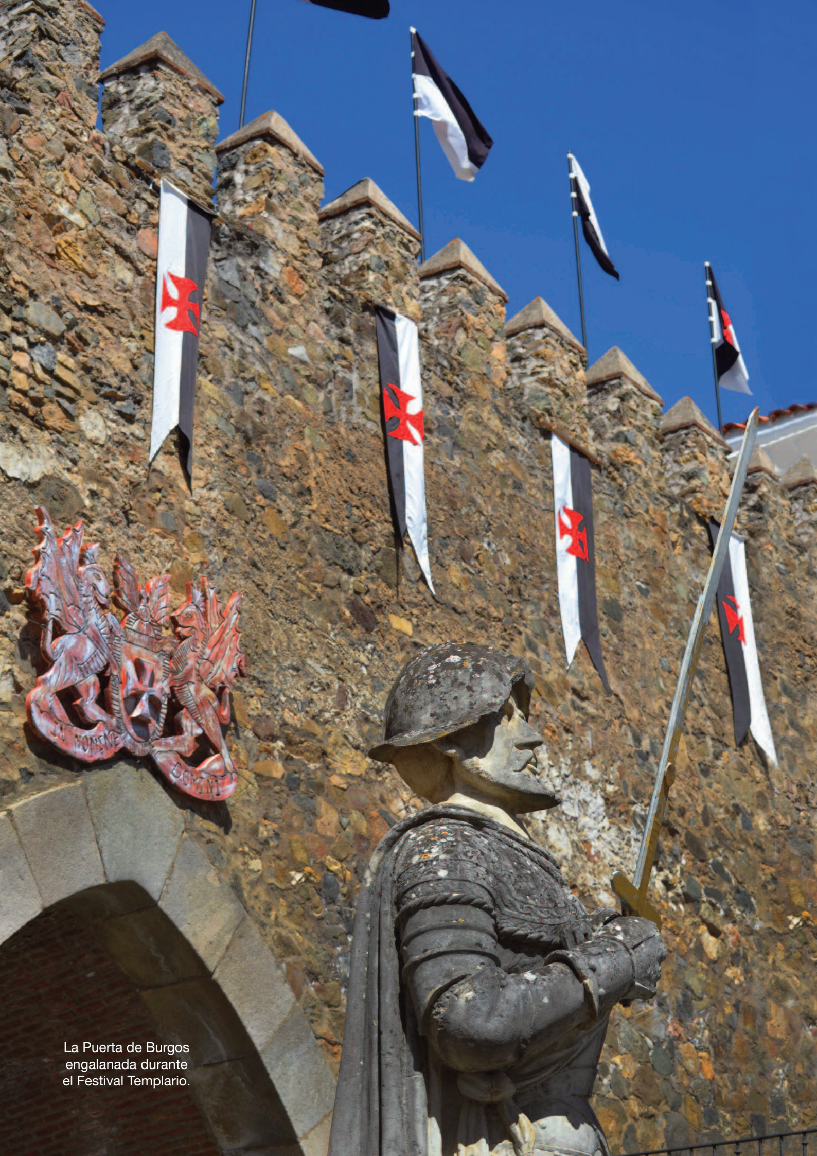
La Puerta de Burgos engalanada durante el Festival Templario.