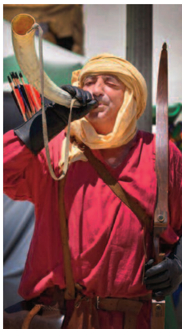
Cada mes de julio se celebra un Festival Templario.

Es el tradicional concurso que abre la temporada de este deporte. Comienza a las doce de la noche en la madrugada del primer domingo de junio. Durante toda esa noche y la mañana siguiente, la orilla de la charca es tomada por pescadores, a quienes se les