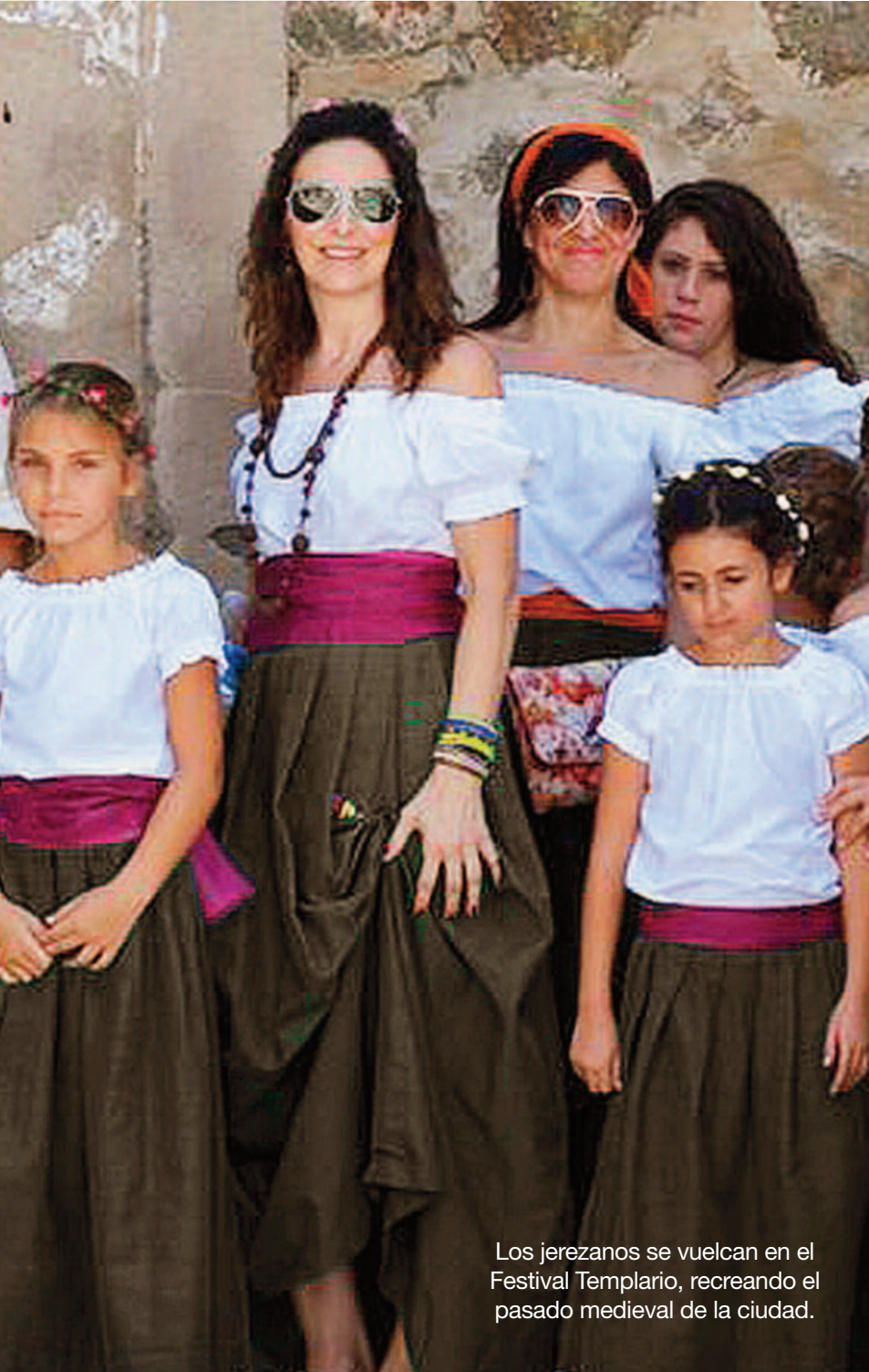
Los jerezanos se vuelcan en el Festival Templario, recreando el pasado medieval de la ciudad.

zaba aparece el actual Palacio de Justicia, que antes fue cárcel de la ciudad.