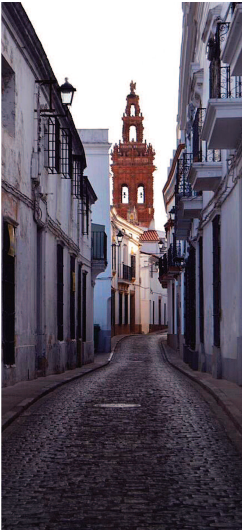
Una de sus empedradas calles y al fondo la iglesia de San Miguel.

La iglesia de San Bartolomé es realmente impactante en lo estético. La fachada principal tiene una gran riqueza decorativa y en ella contrastan los tonos azules, rojos y miel. Su torre recuerda a la Giralda sevillana y es en ese lugar, al intentar captar la foto perfecta entre la iglesia y la torre, pegando nuestra espalda a uno de los caseríos de su empinada calle, donde encontramos, allá en lo alto, la puerta más bonita de Jerez de los Caballeros, esa que no aparece en libros ni guías de viajes, la puerta que nos indica que ahí acaba la ciudad en dirección al firmamento.