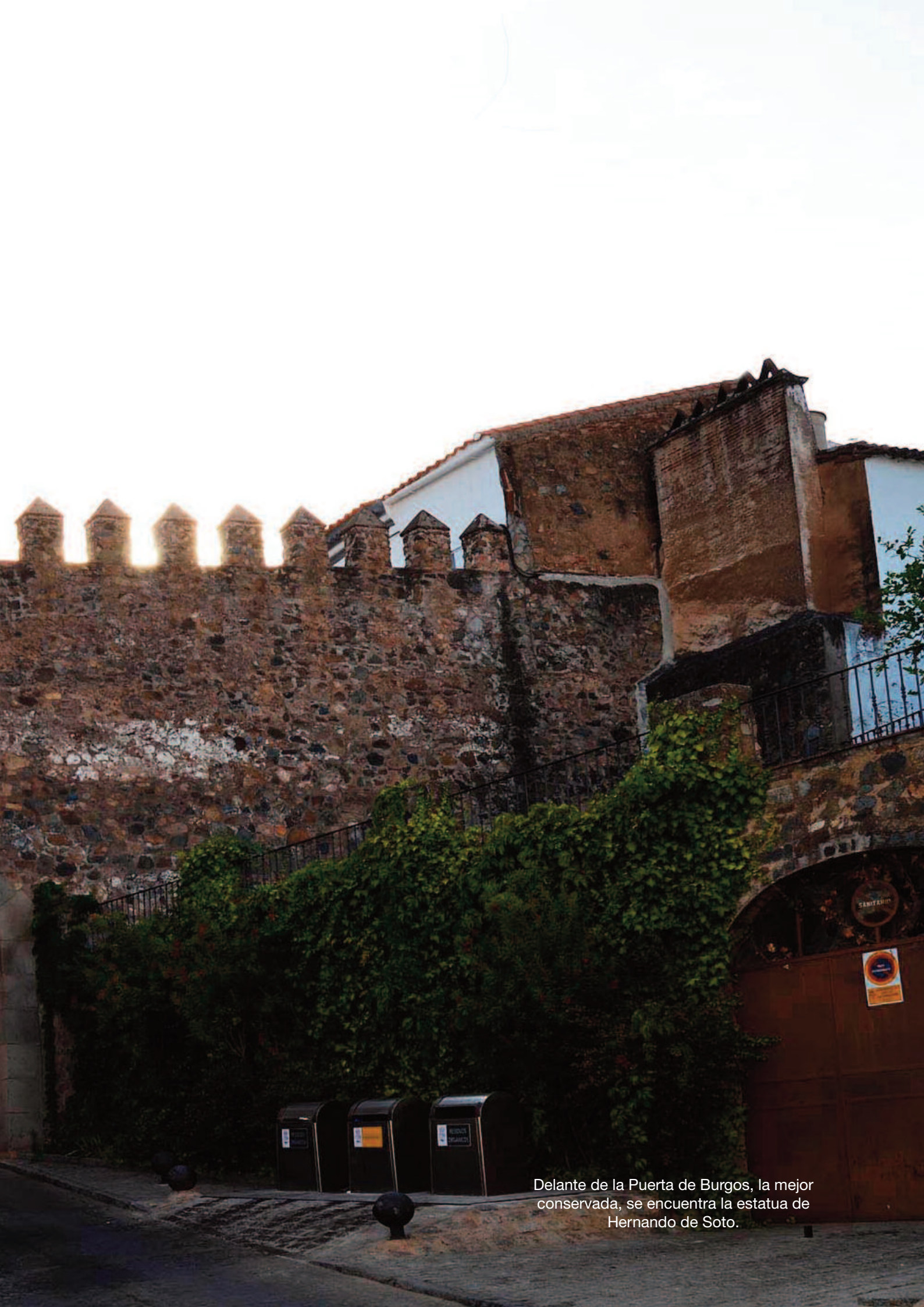
Delante de la Puerta de Burgos, la mejor conservada, se encuentra la estatua de Hernando de Soto.