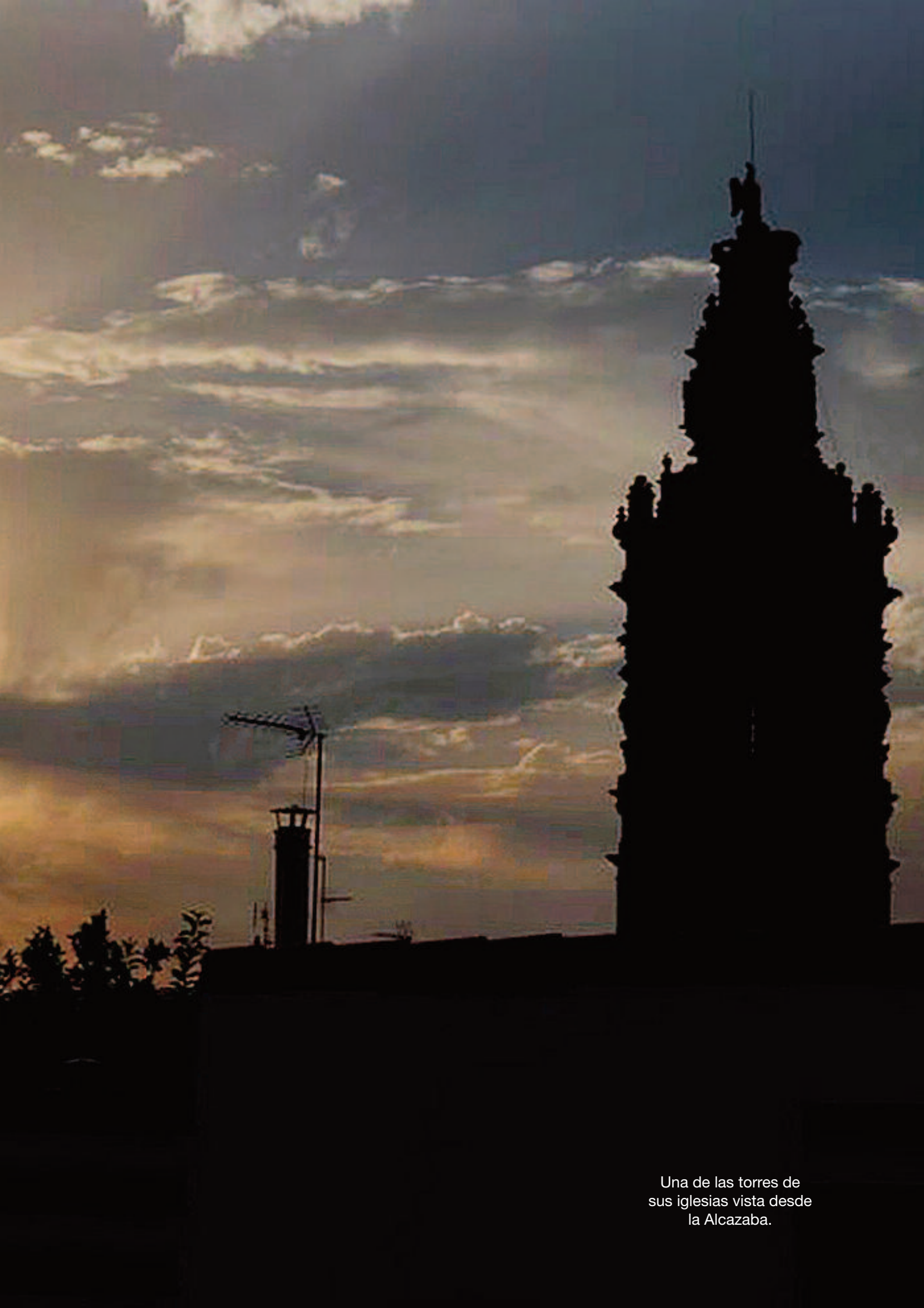
Una de las torres de sus iglesias vista desde la Alcazaba.