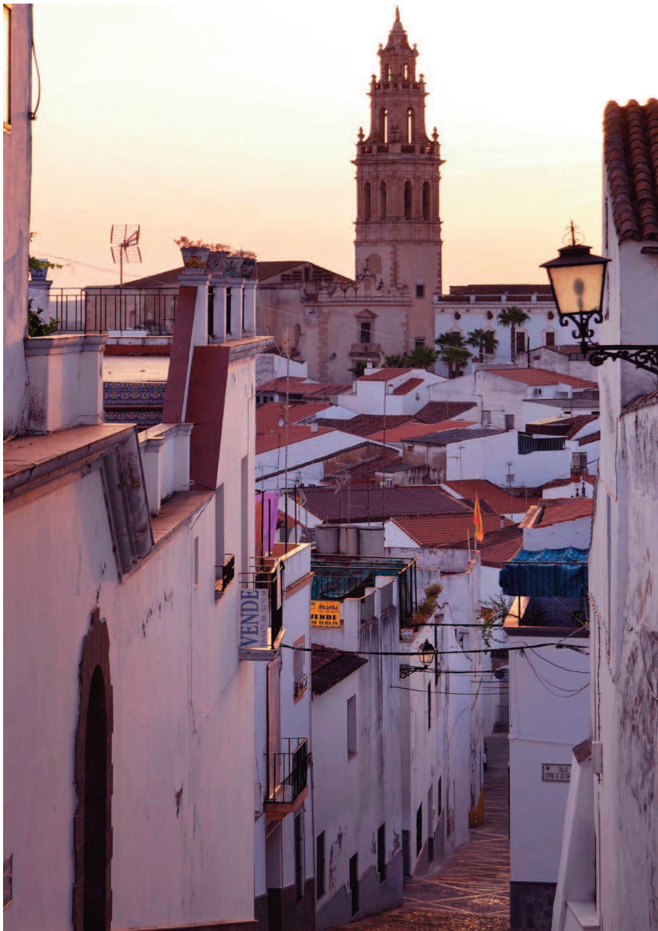
La iglesia de San Miguel, situada en el centro de la ciudad.