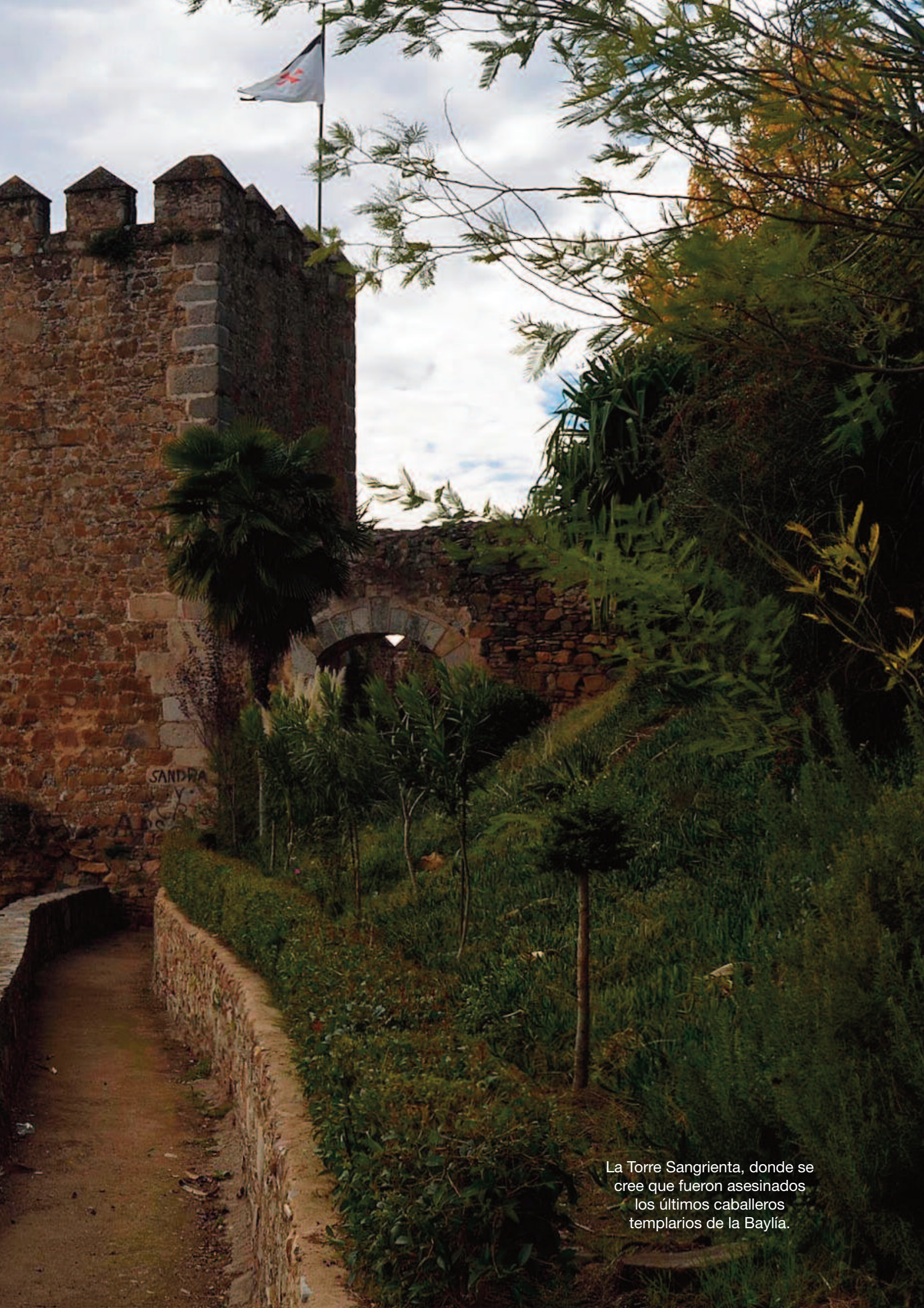
La Torre Sangrienta, donde se cree que fueron asesinados los últimos caballeros templarios de la Baylía.