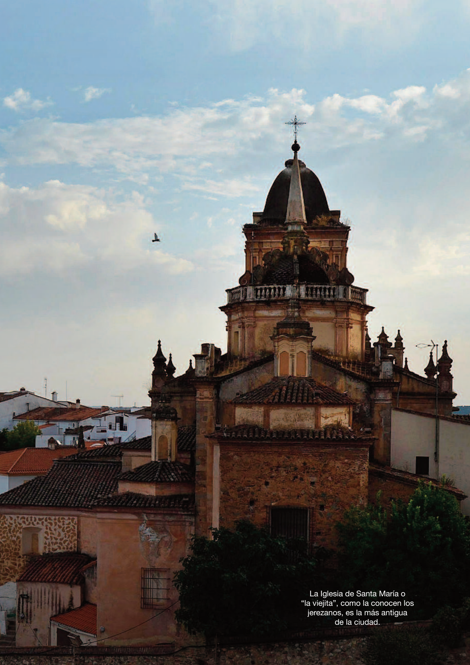
La Iglesia de Santa María o “la viejita”, como la conocen los jerezanos, es la más antigua de la ciudad.