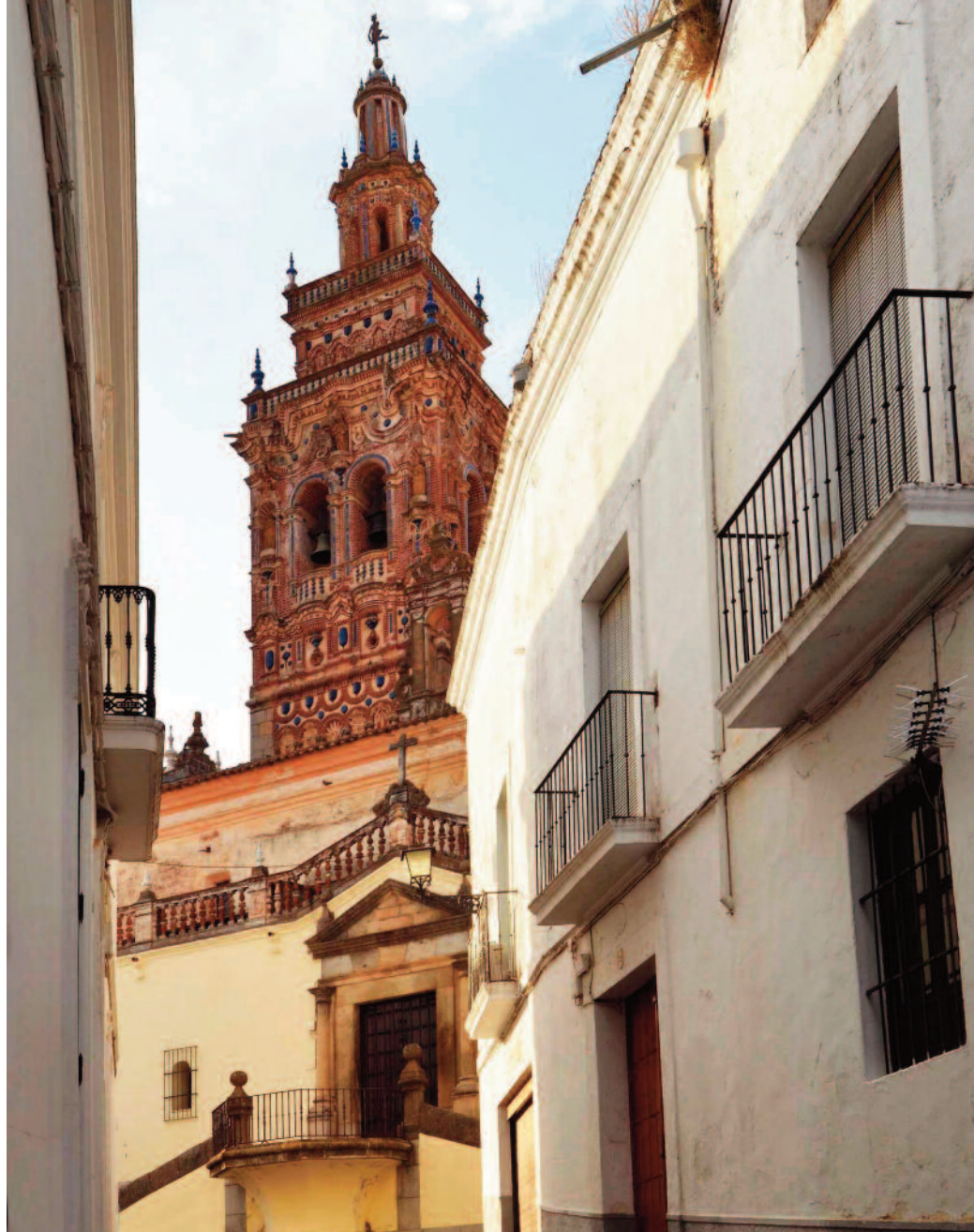
La iglesia de San Bartolomé se sitúa en la zona más alta de la ciudad.

La restauración de la iglesia tras el incendio también trajo consigo el cambio de los suelos de la misma. Hoy reluce el brillo de un