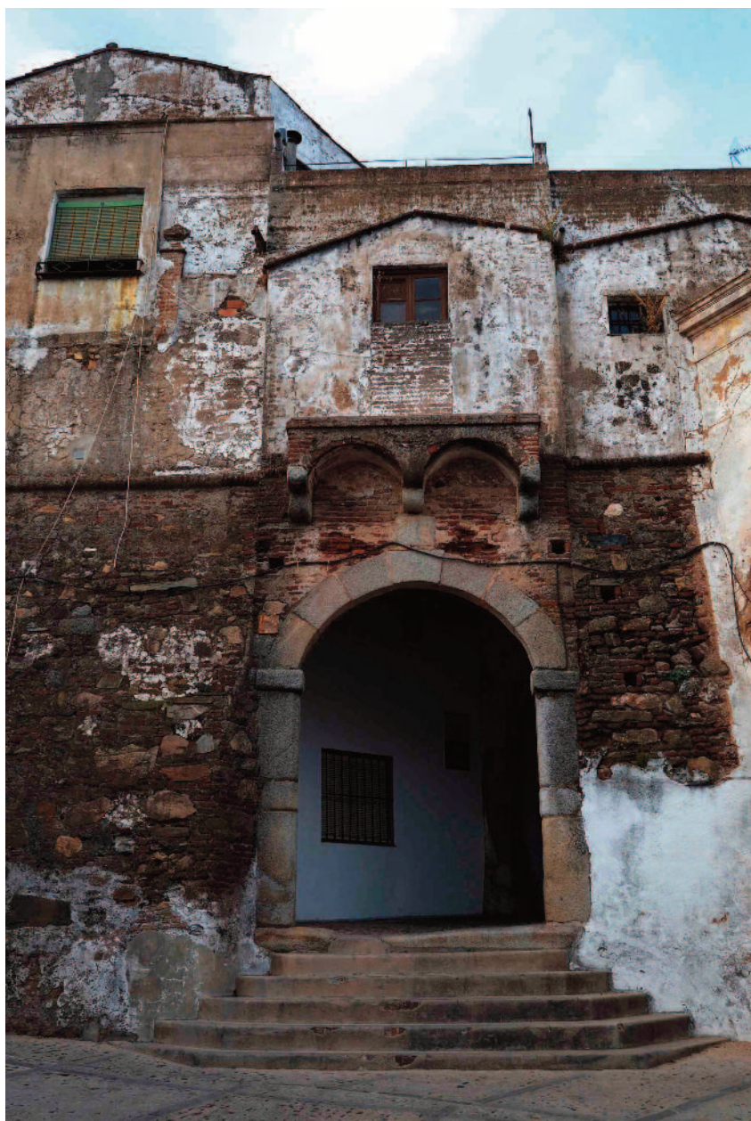
Puerta de la Villa, también conocida como "puerta de San Antoñito".

En la plaza hay unas altas palmeras y gran explanada donde pueden jugar los más pequeños a la pelota así como varios bancos en los que la gente se sienta a conversar o a pasar el rato con un buen libro. De todos, hay uno que es especial. En él hay una escultura en bronce de un nazareno con el capirote en su mano, descansando. Es el homenaje de Jerez de los Caballeros a su Semana Santa, declarada de interés turístico regional desde 1987.